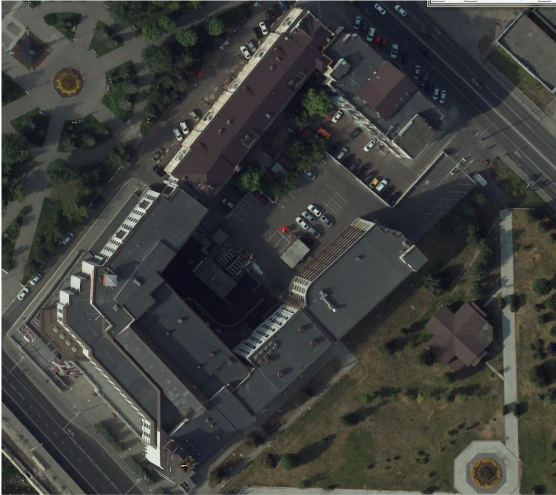
Рис. 1. Фрагмент ортофотоплана

Этих проблем можно избежать при использовании стереофотограмметрических измерений на точках, когда оператор может выбрать необходимый ракурс при наблюдении этих точек на поверхности земли (рис.2), наблюдая сбоку с нужной стороны, выбирая соответствующую стереопару аэроснимков.